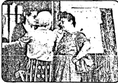
امام لجنة المرأة بالسويدي وفلت السيدات في حيرة .. اين يدلين باصواتهم بعد ان تعمدت السلطة تغيير مكان اللجان